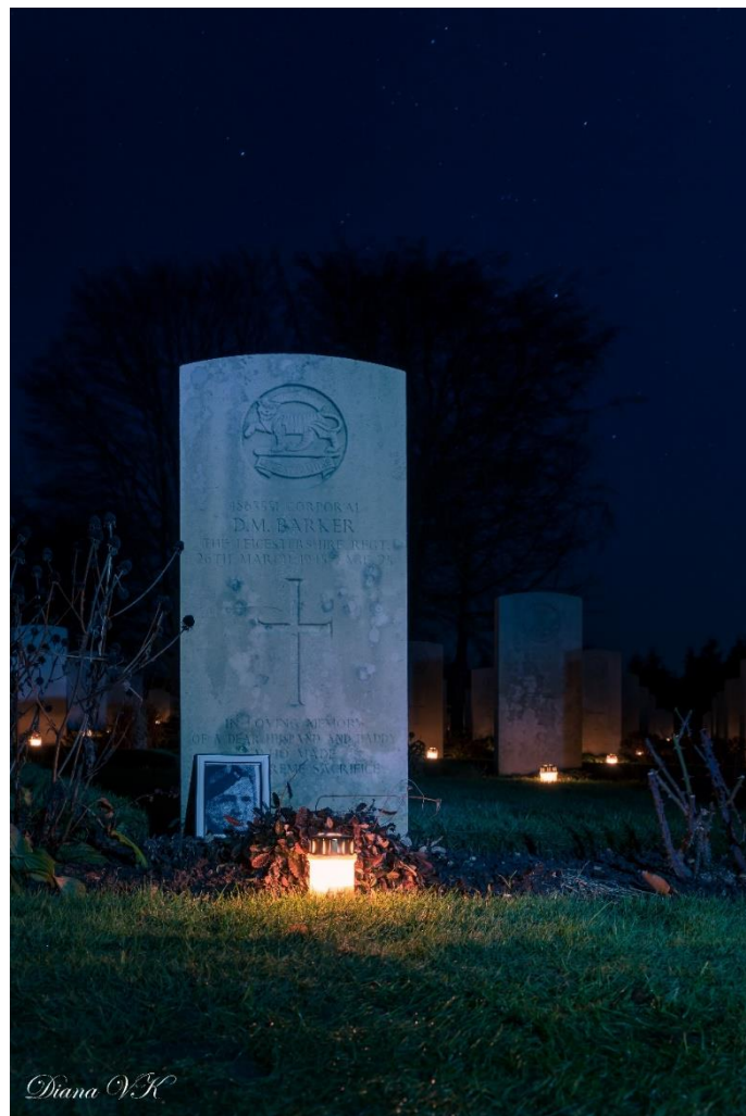
Lichtjesavond 24 december 2018.